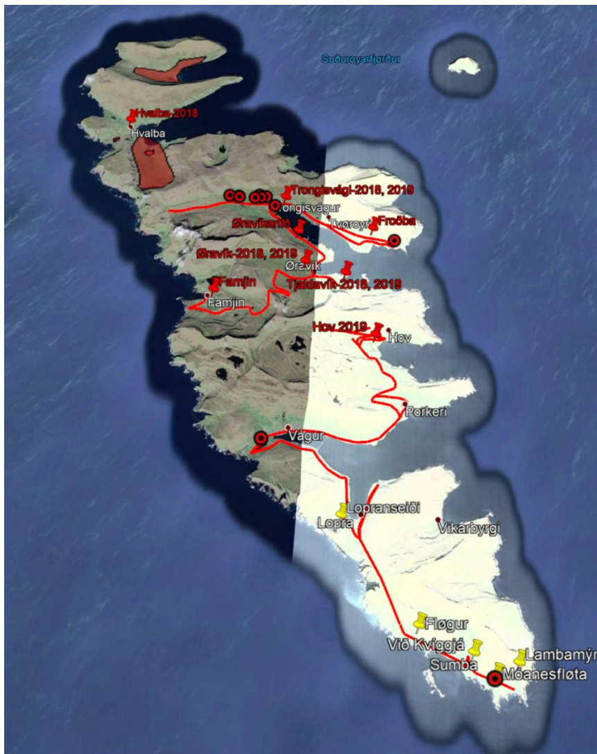
Mynd 2. Yvirlit yvir hvar í landinum teljingarnar av grágás vóru gjørdar í 2018 og 2019.

Á sumri 2018 var talt á 13 ymsum vøtnum, firðum og vatngoymslum runt um landið, har mann veit at grágás samlast. Samlaða talið var 821 grágæs. Hendan teljing var gjørd við bæði kikara og dronu (Mynd 3).