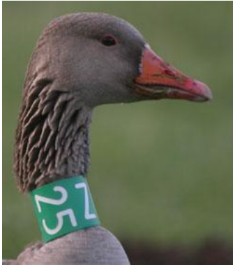
Mynd 1. Grágás merkt við hálsringi.

Aftrat teljingunum í juli, skuldi eitt ávíst tal av gás fangast og merkjast við hálsringum (Mynd 1), ið kundu avlesast við kikara. Endamálið við eini tílkari merking, er fyri at vita hvussu nógv og víða gásin ferðast runt um í Føroyum. Tílik vitan er avgerandi fyri at fáa álítandi tøl fyri stovnsstødd. Eisini hevði tað gjørt tað møguligt at fingi vitan um hvar føroyska gásin ferð um veturin.