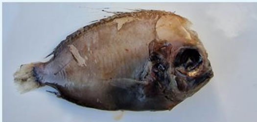
Mynd 1. Ennifiskur ( Platyberyx opalescens ). Støð 22420034, longd: 11,9 cm, vekt: 70 g.

Eins og undanfarin ár so varð gýtandi gulllaksur fingin. Harafrat vóru gýtandi búksvarti hávur, svarthávur og havmús fingin. Nøkur sjáldsom fiskasløg vóru eisini fingin, eitt nú ennifiskur, glæmufiskur, pílfiskur, Jensens hávur og Vahls úlvfiskur.