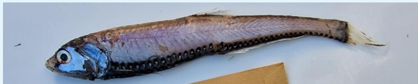
Mynd 2. Glæmufiskur ( Polymetme corythaeola ). Støð 22420038, longd: 18,5 cm, vekt: 23 g.