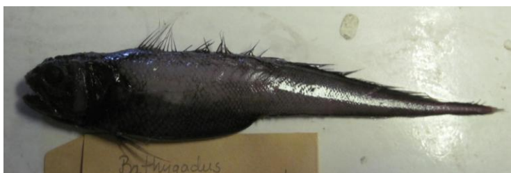
Mynd 2. Langasporl ( Bathygadus sp.) 174 mm langt og 26 g, fingið norðan fyri Bill Baileybanka á umleið 800 m dýpi.

Viðmerkingar: 45 genetikprøvar av blálongu frá 5 ymiskum økjum og 100 genetikprøvar av stórum gulllaksi frá ymiskum økjum vórðu tiknir. Myndir vórðu tiknar av 25 ymiskum sjáldsomum fiskum, sum síðani vórðu frystir (saman við støðnummari) til fiskasavnið hjá Søvnum Landsins. Eisini vórðu nógvir ymiskir forkunnugir fiskar o.a. fryst til Vísindavøkuna.