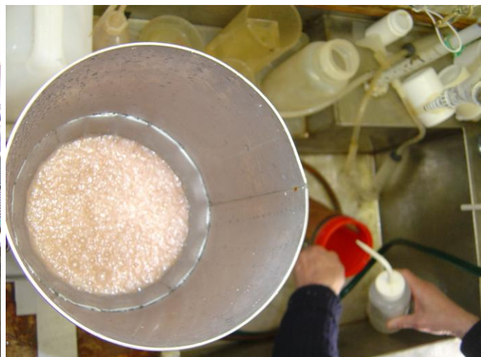
Nýggja útgerðin til at skilja fiskaegg frá djóraæti riggaði stak væl. Smáar luftbløðrur verða sprændar niður í traktina, sum prøvin er í – bløðurnar hanga fastar í djóraætinum, sum so flotnar upp, ímeðan fiskaeggini søkka til botns, og verða tappað av til nærri kanningar.