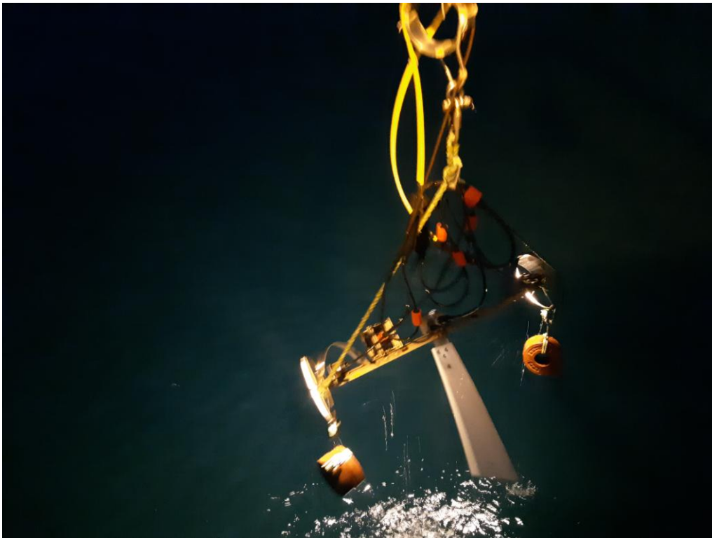
Mynd 1. Útgerð brúkt til videokanning av korallum undir Føroyum í juni 2018. Til eina jarnstong eru fest tvey ljós og tvey kamera, umframt ein stýrifjøður og tvey lodd.

Upptøkurnar vórðu goymdar á harddiski so hvørt, sum støðirnar vórðu tiknar.