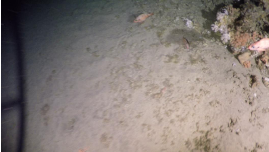
Mynd 6. Fiskur savnast, har korallir eru. Frá støð 18260025, sum var suður av Føroyabanka.