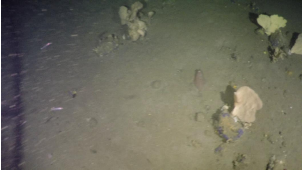
Mynd 4. Svampar ( Phakellia ) og ein flatfiskur á støð 18260063, sum var norður av Suðuroyarbanka. Eisini sæst krill til vinstru á myndini.