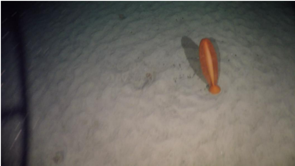
Mynd 7. Ein reyður sjófjøður. Frá støð 18260035, sum var suður av Bill Baileybanka.