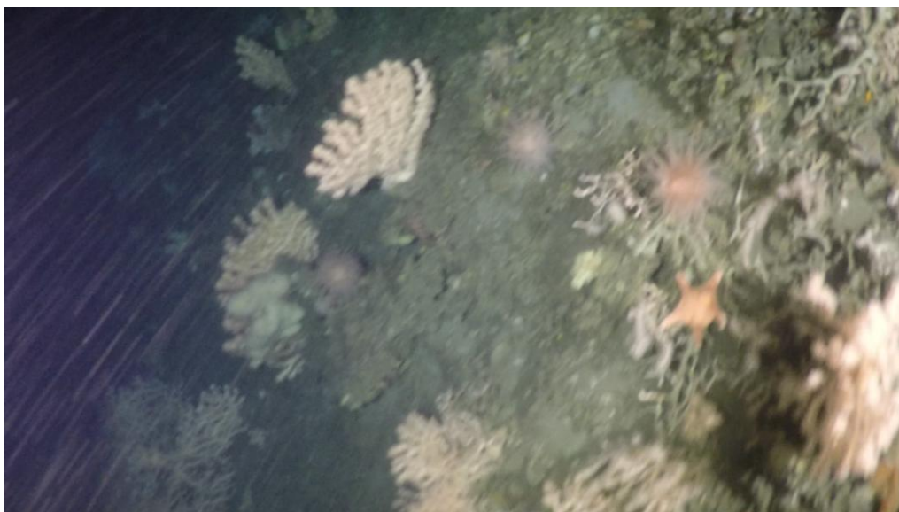
Mynd 3. Deyðar korallir ( Lophelia ) við sjótrøum ( Paragorgia ) á støð 18260059, sum var suður av Sandoyarbanka. Eisini síggjast sjónotur og ein krossfiskur.