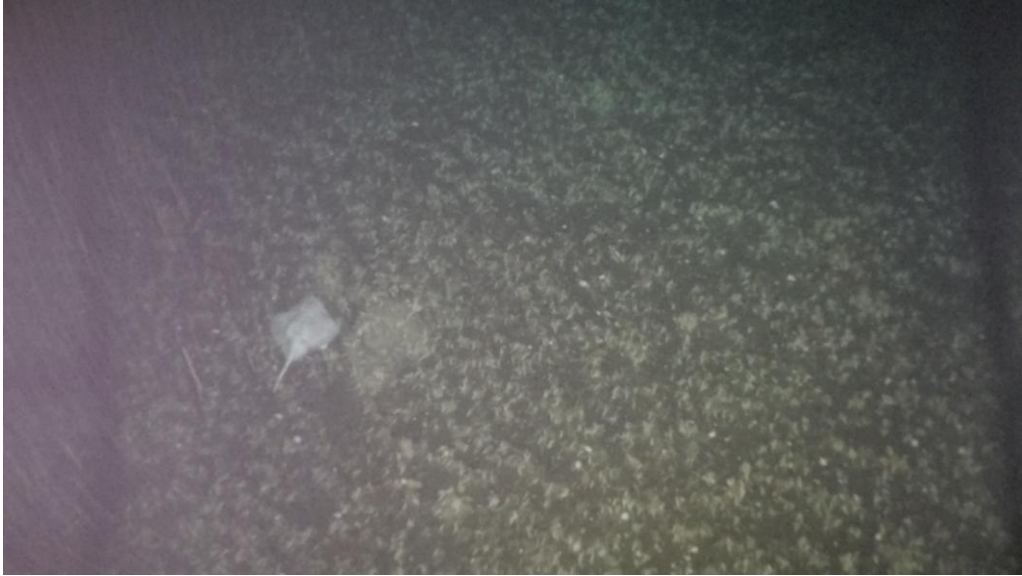
Mynd 8. Skøta í tí ísakalda sjónum norðanvert í Føroyabankarennuni á 865 m dýpi. Frá støð 18260050.

Á Havstovuni 18. juni 2018 Petur Steingrund