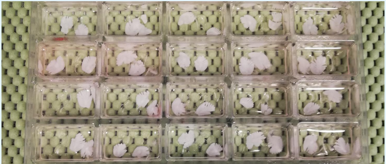
Mynd 2. Svartkalvanytrur.