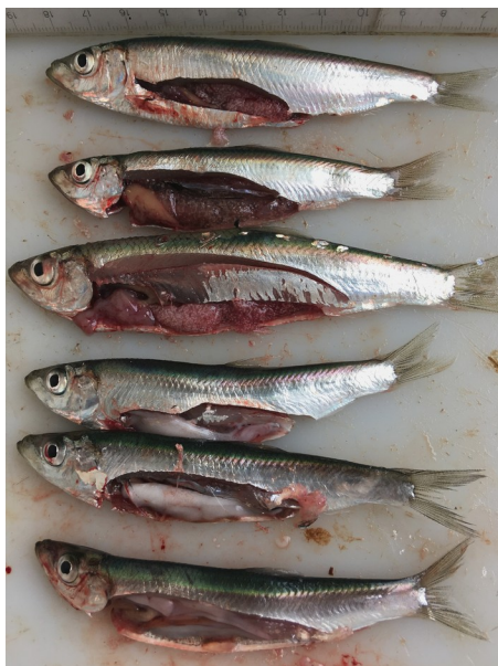
Mynd 3. Brislingur um 10-11 cm, ið var búgvín. Tríggir kvennfiskar ovast og tríggir kallfiskar niðast.