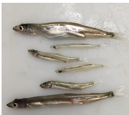
Mynd 4. Lodna á Skálafirði. Ovast er ein 11 cm búgvín kvennfiskur, og undir eru nøkur lodnuýngul um 4-5 cm.