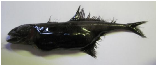
Mynd 2. Chiasmodon niger (á donskum “slukhalsfisk”, á enskum “black swallower”), 115 mm langur og vigar 14 gram. Fingin á umleið 900 metra dýpi millum Føroyabanka og Bill Baileybanka.