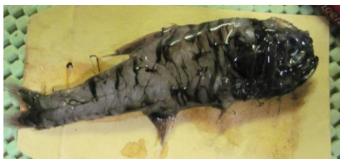
Mynd 3. Scopelogadus beanii (á donskum “Beans kogleskælfisk”, á enskum “Beans bigscale”), 96 mm langur og vigar 14 gram. Fingin á umleið 800 metra dýpi norðan fyri Bill Baileybanka.

Viðmerkingar: Ymiskir forkunnugir fiskar o.a. vórðu fryst til Vísindavøkuna. Viðmerkingar (smálutir av ymsum slagi) til túrin eru skrivaðar í imp-útskriftirnar.