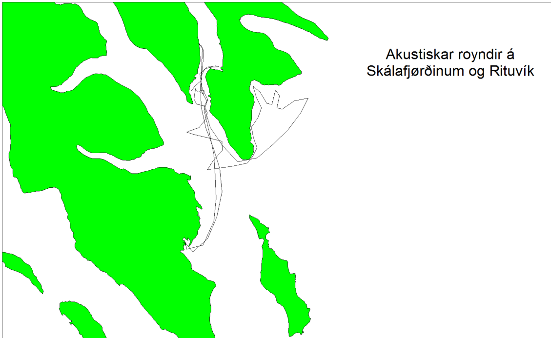
Mynd 1. Siglingarleiðin á fyrra parti av túri 1308, 14-19/3-2013.