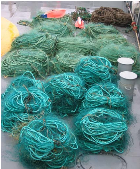
Mynd 7. Nakað av fonginum.