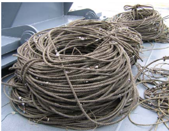
Mynd 9. Lina (legg 2).