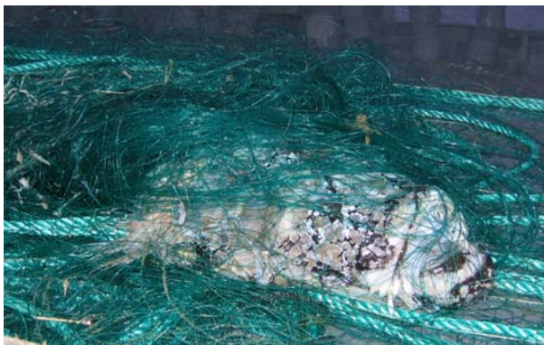
Mynd 4. Havtaska fingin í gørnum í leggi 13.