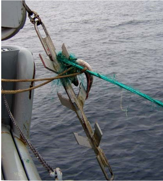
Mynd 5. Gørn á dregginum (legg 15).