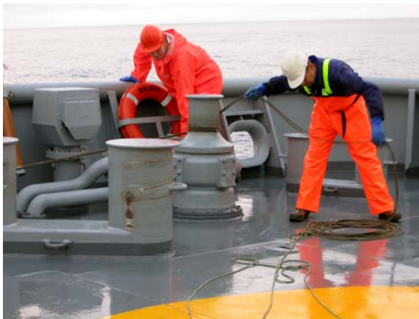
Mynd 2. Lína verður drigin við koppi.