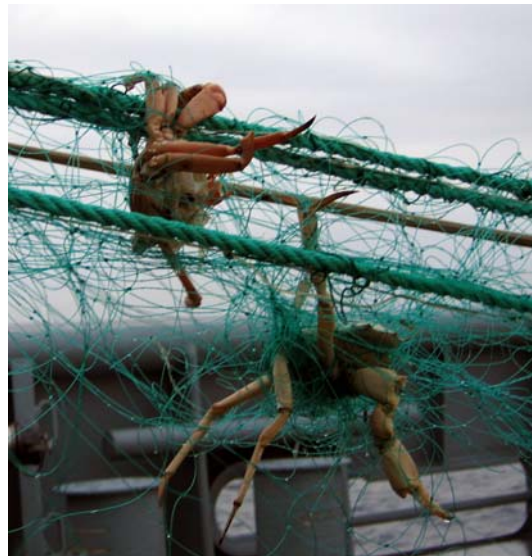
Mynd 6. Krabbar.