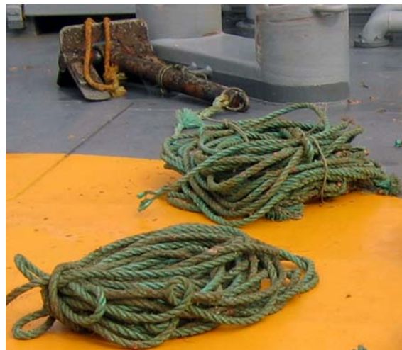
Mynd 8. Varp og standari til gørn.