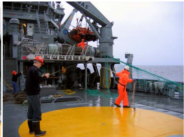
Mynd 3. Gørn verða gilsaði upp.